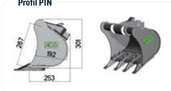
DE365 17-7 Épaisseur 15 mm