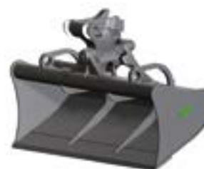
LAME LISSE Épaisseur 20 mm