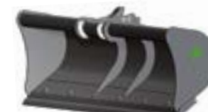
CONTRE-LAME BOULONNÉE RÉVERSIBLE Épaisseur 20 mm