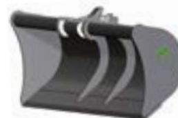
LAME LISSE Épaisseur 20 mm