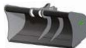
LAME LISSE Épaisseur 20 mm